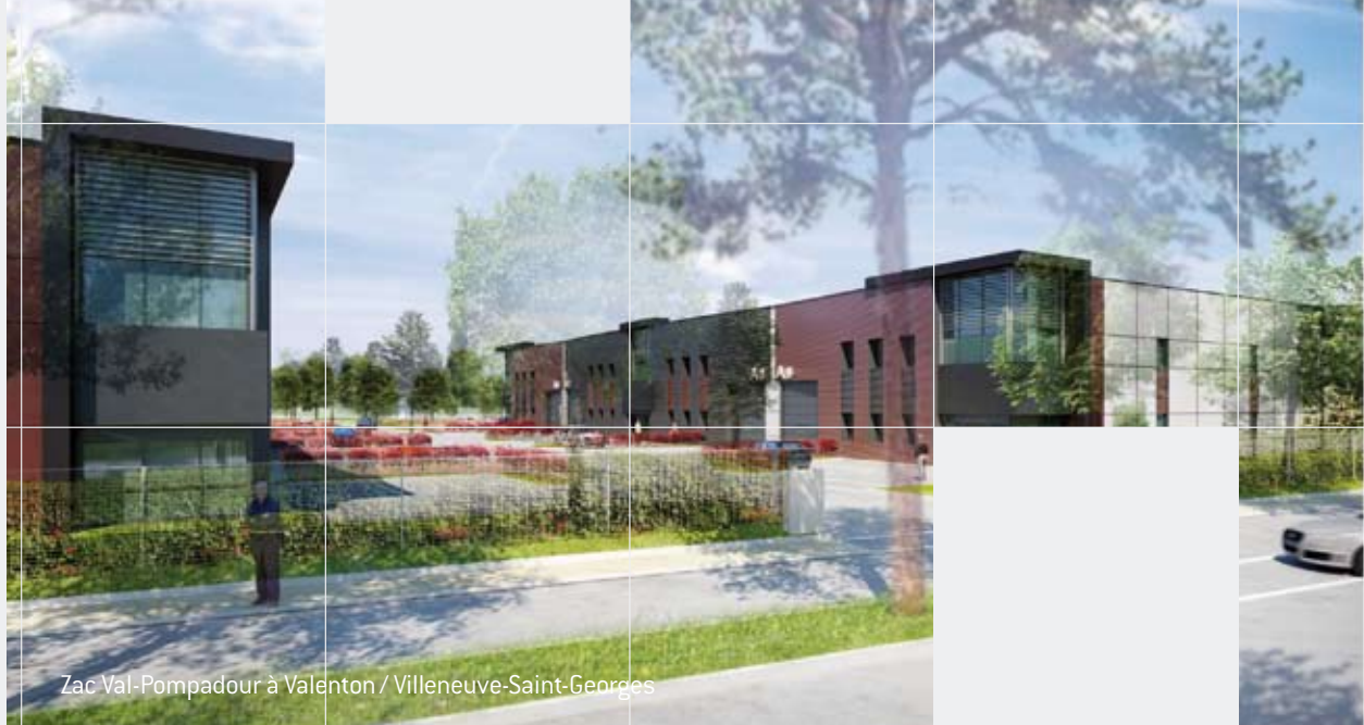
Zac Val-Pompadour à Valenton / Villeneuve-Saint-Georges