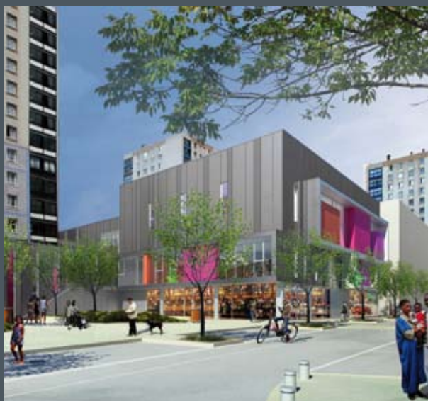
Les Mordacs, vue depuis la place

Effectivement ! Ce phasage est d'autant plus complexe qu'il doit impérativement respecter les délais attribués aux différentes étapes puisque l'activité est maintenue pendant les travaux. Pour réaliser ce défi, nous avons opté pour une restructuration en quatre temps : scinder le bâtiment en deux parties et créer un passage, rénover l'immeuble qui hébergera des commerces et la Maison pour Tous, puis démolir et reconstruire le centre commercial et enfin réaliser les espaces publics.